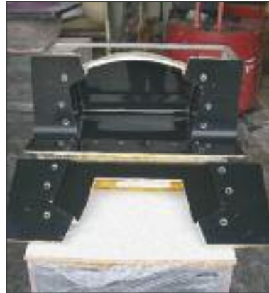
Die gleiche mehrteilige Laminierform geöffnet