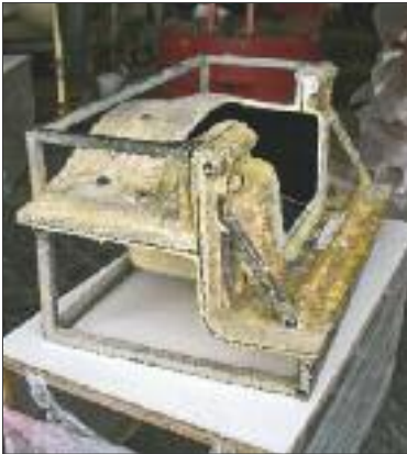
Multiple laminated mould closed